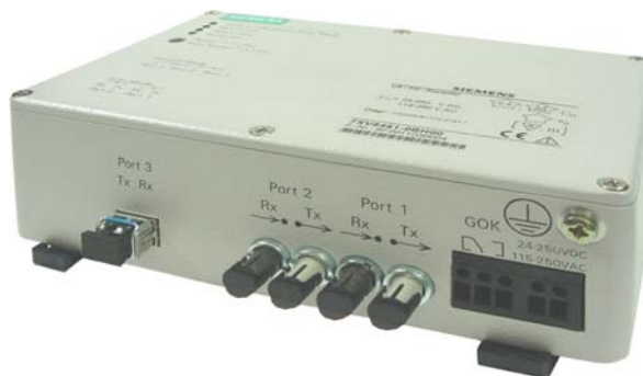
Bild: Optischer Repeater mit Weitbereichsnetzteil