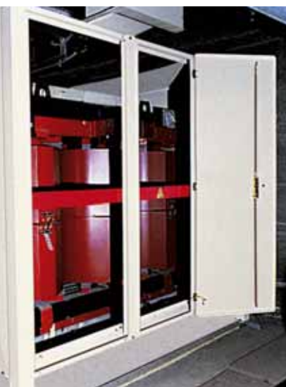
En alta mar: GEAFOL sube a bordo

Debido a las buenas experiencias hechas con estos transformadores, en 1988 también fue equipada del mismo modo la plataforma de Oseberg. Lleva 23 transformadores a bordo – para una demanda de energía igual a la de una ciudad de 40000 habitantes. Entretanto se han construido más plataformas de alta mar con transformadores GEAFOF, y todavía hay más en construcción.