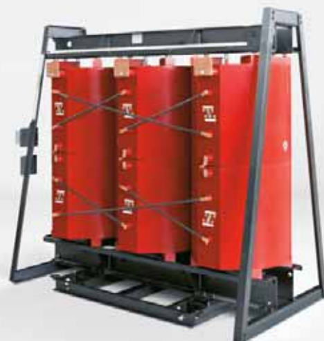
Transformador GEAFOLE de 7,5 MVA para temperaturas del aire ambiente especialmente bajas de hasta -55^{\circ}\text{C}