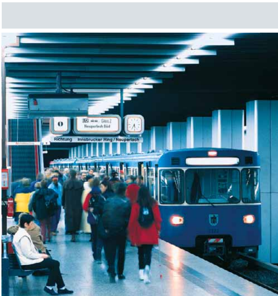
Tráfico sin problemas: GEAFOL en el metro de Munich, Alemania

Hubo que prestar especial atención a los parámetros decisivos para el motor lineal – p.ej. la frecuencia de servicio, armónicas y componentes de c.c. dependientes de los onduladores. Debido a su alta fiabilidad, los transformadores GEAFOLE no presentaron problema alguno bajo estas condiciones de aplicación tan duras.