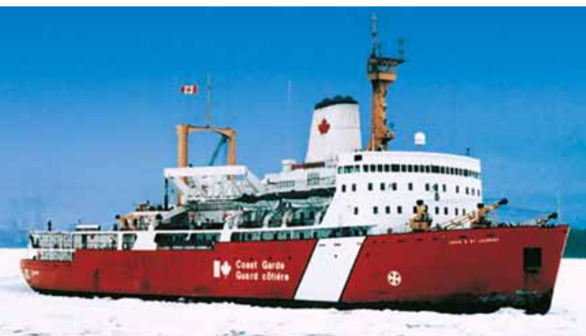
Más allá del círculo polar: GEAFOL a bordo de los rompehielos