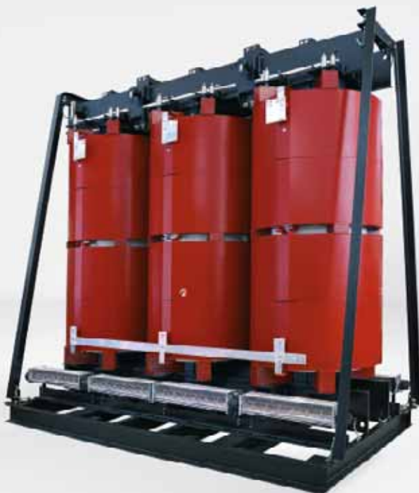
Transformador GEAFOL de 40 MVA, año de fabricación 2007, el transformador de resina colada más potente del mundo