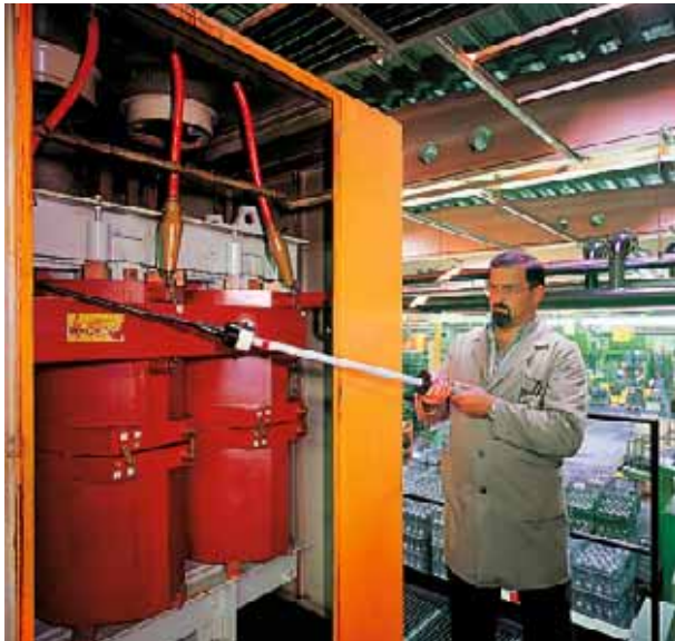
En servicio día a día durante 20 años en ambiente agresivo, con poco mantenimiento.