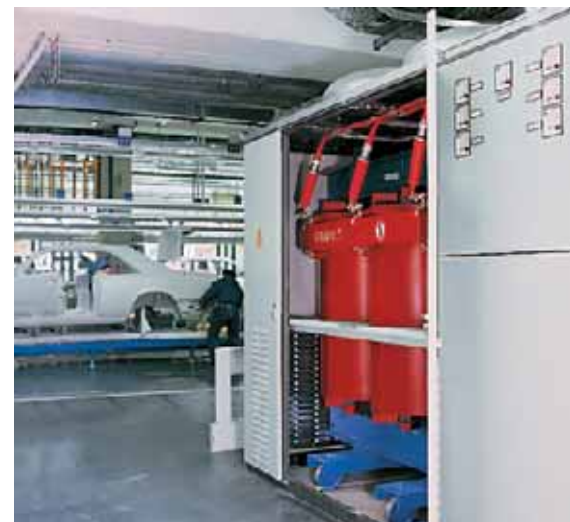
Seguro: El transformador se encuentra directamente junto a la línea de montaje.