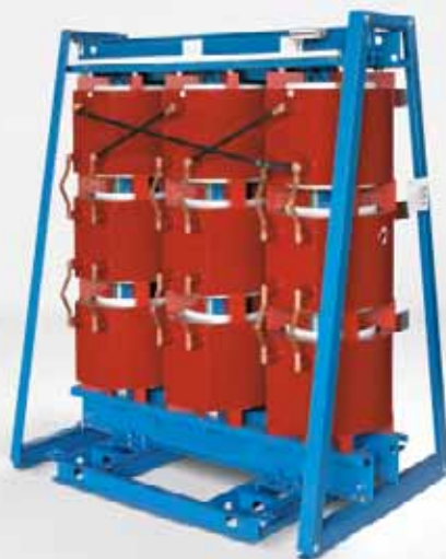
Convertidor estático GEAFOLE Ejecución de 3 niveles