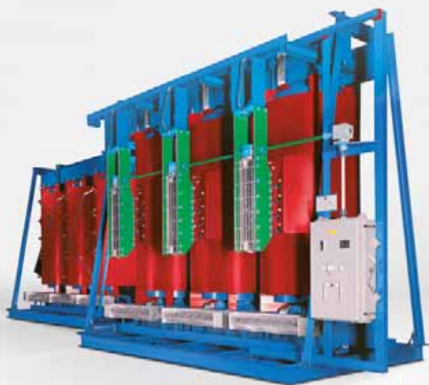
Transformador GEAFOL de 22 MVA con conmutador de tomas sin aceite

Actualmente hay más de 80000 transformadores de resina colada GEAFOL en servicio en todo el mundo. Este folleto le ofrece un resumen de su amplia gama de aplicación y potencia.