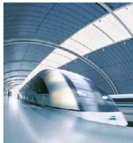
Al aeropuerto de Shanghai, a 430 km/h