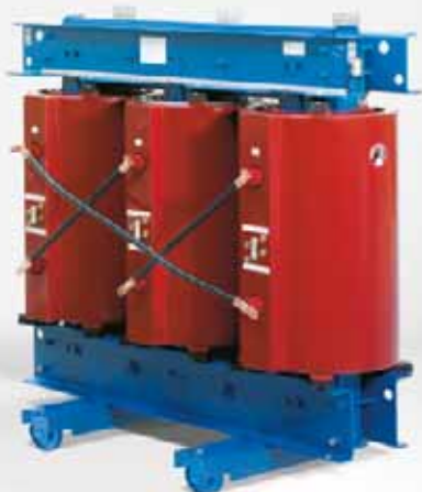
Transformador de resina colada GEAFOLE 1000 kVA en ejecución estándar

Hoy en día, con los transformadores GEAFOLE se pueden realizar potencias de hasta 40 MVA sin problemas.